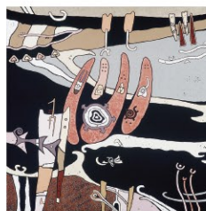
ウエチヒロ UECHI Hiro 《アーマン世(太古)「海のかたりべ」》A-man (Ancient Times) "The Story teller of the Sea" 2005年